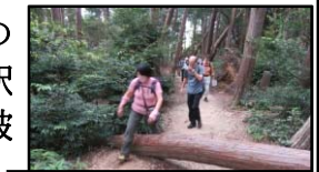
倒木を跨いで登坂

久しぶりの健脚コースです。心わくわく蹴上駅を出発、台風21号(昨年)の爪痕である倒木を跨いだりぐったりして、山頂に到着しました。京都大展望を楽しみながら昼食。食後は魔の急坂を下り、大文字の火床にたどり着き休憩し、長くて段差の大きい階段を下り京阪出町柳駅に無事ゴール、難コースを踏破できた感激をかみしめました。